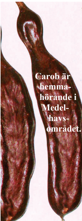
Carob är hemmahörande i Medelhavsområdet.